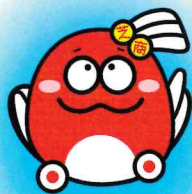
芝商ゆるキャラ 「しばりん」